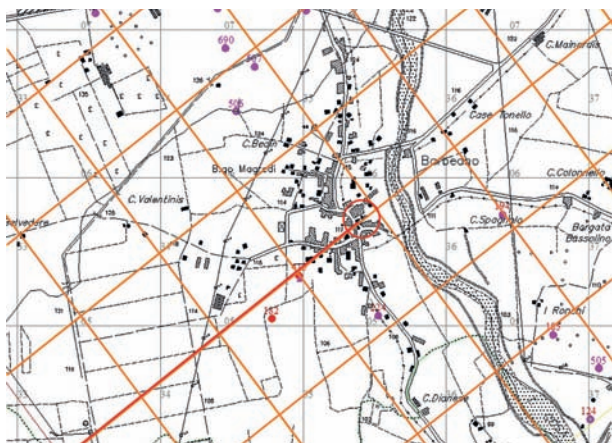
Centuriazione romana a Barbeano e Tauriano (CTR Insiel spa).