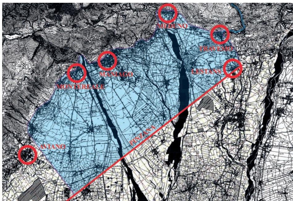
Rappresentazione delle pertinenze di pianura di Julium Carnicum.