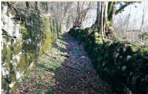
Viste di come si presenta il sentiero in molti dei suoi tratti (Foto Elio Dusso).

sua importanza bisogna premettere e ricordare che i traffici provenienti da nord attraverso il Tarvisiano (Canale del Ferro) convergevano a Paluzza, sulla via del passo di Montecroce Carnico, passando per la valle del torrente Pontebbana [...], il passo di Cason di Lanza, e poi il passo di col Duron, perché la forra del torrente Fella tra Pontebba e Chiusaforte era assolutamente impraticabile 6 . Per questo la valle del Tagliamento in prossimità dell'odierna Tolmezzo era un grande crocevia viario e commerciale. È naturale immaginare che talune persone e mercanzie dirette all'ovest, sulla pianura friulano-veneta non scendessero attraverso il percorso Amaro-Gemona, bensì da Zuglio per Enemonzo e Preone su Lestans, attraverso questa strada ancora tutta da riscoprire.