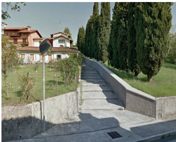
Lestans, punto di partenza della 'Via dei Carnici Antichi'.

costruita dai romani che partiva da Concordia ed era diretta in Germania. A parer suo, essa giungeva al guado sul Tagliamento tra Pinzano e Ragogna, passava oltre e si riuniva alla grande via che portava da Aquileia alla terra dei Nori. Egli la chiamò impropriamente 'via Giulia', perché allora si usava dedicare le strade romane a Giulio Cesare, ma la strada era scomparsa o quantomeno invisibile. Ne testimoniavano però la presenza i tanti insediamenti romani che apparivano qua e là e poi, di seguito, i toponimi con la desinenza in "ano": Provesano, Barbeano, Tauriano.