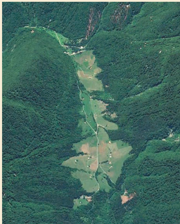
Vista a volo d'uccello di Sella Chiampon, dove il sentiero scende a Enemonzo.

Gli allevamenti ovini e caprini transumanti dell'alta pianura e degli alpeggi erano valide risorse per l'economia delle valli montane.